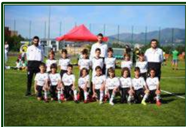
SL BENFICA – 1.º CLASSIFICADO – SUB-9