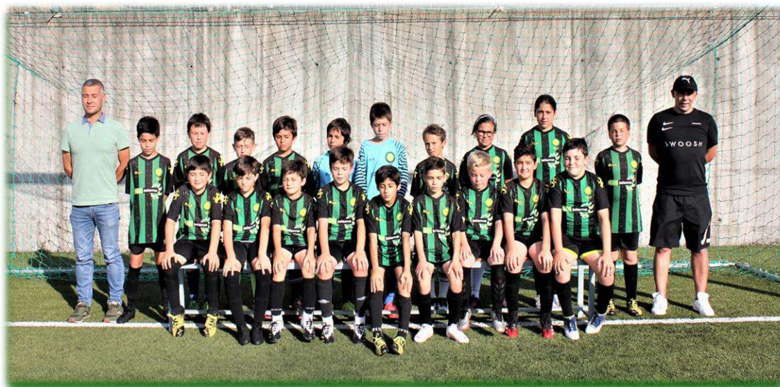
BENJAMINS – SUB 10 2020/2021