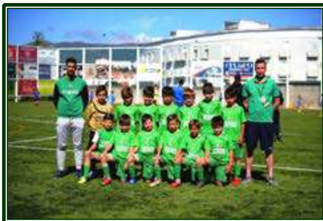
ACRCO O CRASTO – 1.º CLASSIFICADO – SUB-