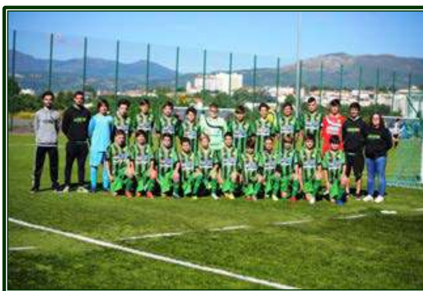
ABAMBRES SC – 1.º CLASSIFICADO – SUB-13