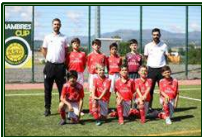
SL BENFICA – 1.º CLASSIFICADO – SUB-11