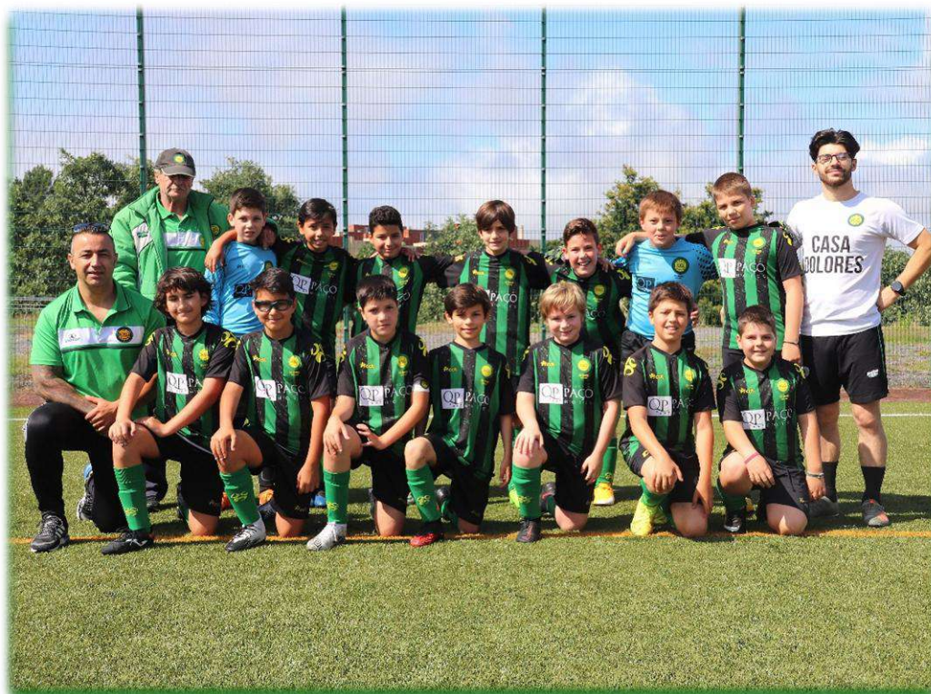
BENJAMINS – SUB 11 2020/2021